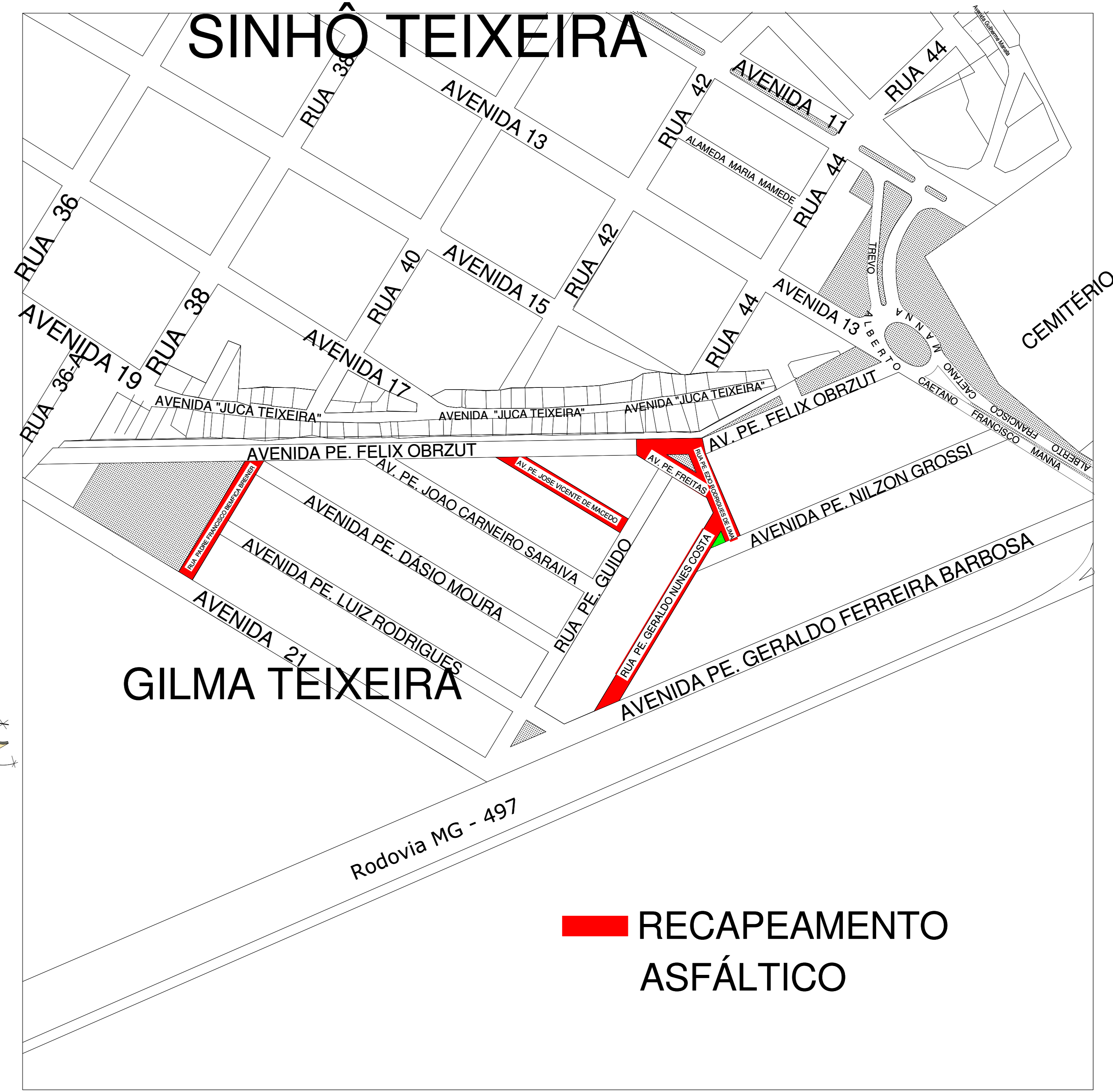
8 MAPA DO BAIRRO 1 : 2000